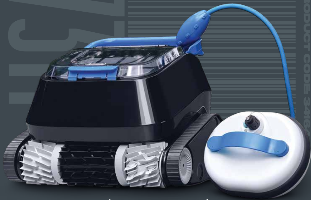
Плавающий аккумуляторный блок